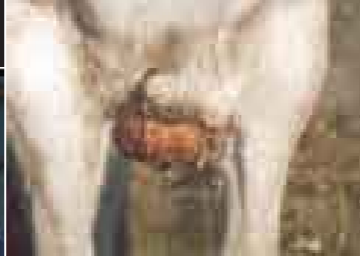
Schimmel Joe vor (r.o.) und nach (r.u.) der Behandlung. Nach der operativen Entfernung eines Tumors bekam er dendritische Zellen injiziert