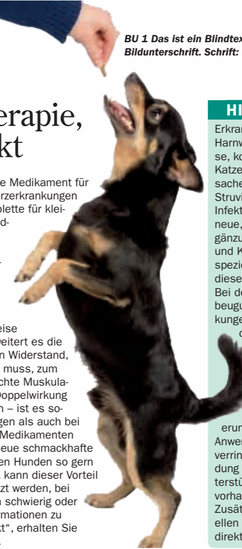
BU 1 Das ist ein Blindtext für die Bildunterschrift. Schrift: BI Franklin

Das in Deutschland führende Medikament für Hunde mit chronischen Herzerkrankungen ist ab sofort als leckere Kautablette für kleine Hunde erhältlich. Die Behandlung kleiner Hunderassen, die häufiger an Herzerkrankungen leiden, gleichzeitig aber die Einnahme von Tabletten oder Kapseln nicht gut akzeptieren, wird damit maßgeblich verbessert. Denn: Das moderne Herzpräparat vereint in einzigartiger Weise zwei Wirkungen. Zum einen erweitert es die Blutgefäße und senkt damit den Widerstand, gegen den das Herz anpumpen muss, zum anderen stärkt es die geschwächte Muskulatur des Herzens. Dank dieser Doppelwirkung – so belegen zahlreiche Studien – ist es sowohl bei Herzmuskelerkrankungen als auch bei Herzklappenfehlern bisherigen Medikamenten deutlich überlegen. Durch die neue schmackhafte Kautablette, die von den meisten Hunden so gern gefressen wird wie ein Leckerli, kann dieser Vorteil nun auch bei Vierbeinern genutzt werden, bei denen die Einnahme von Kapseln schwierig oder gar unmöglich ist. Weitere Informationen zu der „Herztherapie, die schmeckt“, erhalten Sie ab sofort in Ihrer Tierarztpraxis.